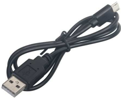
USB Power Cable